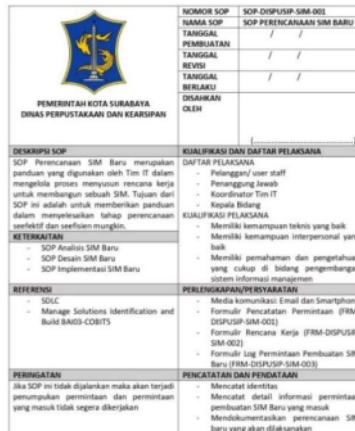
Gambar 1. Deskripsi dan Informasi SOP Perencanaan SIM Baru

Panduan pembuatan SOP mengacu pada Peraturan Menteri PANRB Nomor 35 Tahun 2012 dan menggunakan format *flowchart* untuk menangani banyaknya langkah dan keputusan. Gambar 1, 2, dan 3 menampilkan deskripsi, alur prosedur, dan formulir SOP dari lima prosedur tersebut. SOP lengkap tersedia dalam buku SOP pengembangan SIM DISPUSIP. Deskripsi dan informasi SOP Perencanaan SIM Baru ditunjukkan pada Gambar 1.