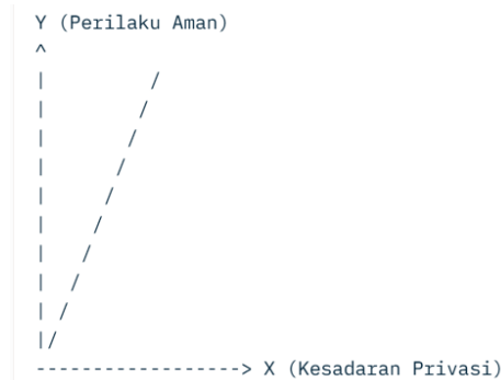
Gambar 2. Untuk pembuatan kustom tanpa menggunakan alat, representasi ASCII dapat digunakan untuk mendekati bentuk kurva.

Gambar tersebut menunjukkan kerangka konseptual hubungan antar variabel dalam penelitian. Variabel X berperan sebagai variabel independen yang memengaruhi variabel Y sebagai variabel dependen, baik secara langsung maupun dengan melibatkan variabel lain. Variabel Z berfungsi sebagai variabel moderator yang memengaruhi kekuatan atau arah hubungan antara X dan Y, sedangkan variabel M berperan sebagai variabel intervening yang menjadi perantara pengaruh X terhadap Y. Kerangka ini digunakan untuk memperjelas model hubungan antar variabel yang dianalisis dalam penelitian.