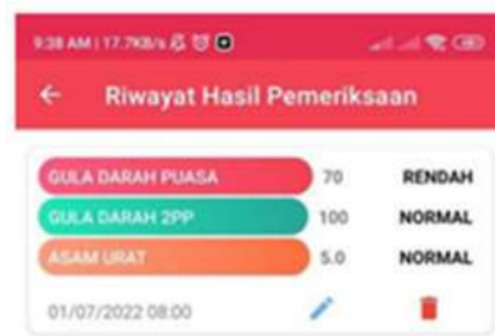
Gambar 5 Riwayat Hasil Pemeriksaan

Selanjutnya Menu riwayat berisi tabel daftar pemeriksaan yang sebelumnya telah dimasukkan dalam menu input data. Pada menu input data apabila ditekan submit atau simpan akan langsung terhubung pada menu riwayat seperti pada gambar disamping. Menu riwayat akan dimunculkan dalam bentuk semi tabel kolom dengan nilai hasil pemeriksaan yang telah dimasukkan beserta dengan keterangan hasilnya. Kategori keterangan hasil muncul secara otomatis berdasarkan jenis kelamin yang didaftarkan pada menu profile dengan acuan standar setiap parameter pemeriksaan. Terdapat pula kolom tanggal yang dapat diubah sesuai dengan tanggal pemeriksaan sebelumnya. Tanggal akan mempengaruhi pengingat untuk kontrol yang akan dilakukan selanjutnya. Fitur pada menu riwayat adalah delete atau hapus untuk menghilangkan data yang telah dimasukkan. Tampak tabel seperti ini akan terus muncul pada setiap bulan setelah dilakukan pemeriksaan laboratorium dan diinputkan dalam menu input data.