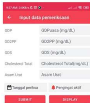
Gambar 4. Halaman Input Data Pemeriksaan

Setelah melakukan penyimpanan, user juga dapat melakukan edit profil sesuai data yang dimasukkan. Data yang dimasukkan hanya data pokok saja seperti jenis kelamin, tanggal lahir, berat badan. Kemudian Menu input data digunakan untuk memasukkan dan meninjau data pemeriksaan serta memilih ragam pemeriksaan yang sebelumnya telah dilakukan dalam laboratorium. Menu input data juga memiliki fitur submit untuk menyimpan hasil input data yang telah dilakukan dan display untuk meninjau data, fitur display langsung merujuk pada menu riwayat. Pemeriksaan yang dapat dipilih untuk diinput adalah pemeriksaan gula terdiri dari gula darah puasa, paska makan dan sewaktu, ada pula kolesterol total sebagai pemeriksaan lipid dan asam urat. Kelima pemeriksaan dipilih karena dapat mengimplementasikan masing-masing faal dan merupakan pemeriksaan yang sering dilakukan. Fitur lain yang terdapat dalam menu input data adalah tanggal dan waktu pemeriksaan dilakukan, fitur ini berguna untuk data pengingat aktif pada bulan selanjutnya. Fitur terakhir adalah pengingat aktif dan nonaktif, tombol ini hanya perlu disentuh untuk mengaktifkan dan menonaktifkan.