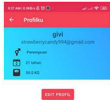
Gambar 3. Halaman Profil

Setelah melakukan penyimpanan, user juga dapat melakukan edit profil sesuai data yang dimasukkan. Data yang dimasukkan hanya data pokok saja seperti jenis kelamin, tanggal lahir, berat badan. Kemudian Menu input data digunakan untuk memasukkan dan meninjau data pemeriksaan serta memilih ragam pemeriksaan yang sebelumnya telah dilakukan dalam laboratorium. Menu input data juga memiliki fitur submit untuk menyimpan hasil input data yang telah dilakukan dan display untuk meninjau data, fitur display langsung merujuk pada menu riwayat. Pemeriksaan yang dapat dipilih untuk diinput adalah pemeriksaan gula terdiri dari gula darah puasa, paska makan dan sewaktu, ada pula kolesterol total sebagai pemeriksaan lipid dan asam urat. Kelima pemeriksaan dipilih karena dapat mengimplementasikan masing-masing faal dan merupakan pemeriksaan yang sering dilakukan. Fitur lain yang terdapat dalam menu input data adalah tanggal dan waktu pemeriksaan dilakukan, fitur ini berguna untuk data pengingat aktif pada bulan selanjutnya. Fitur terakhir adalah pengingat aktif dan nonaktif, tombol ini hanya perlu disentuh untuk mengaktifkan dan menonaktifkan.