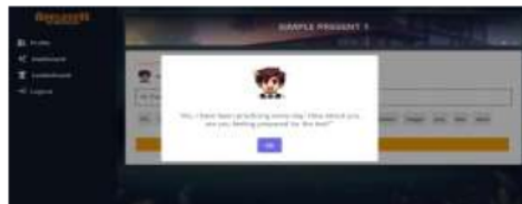
Gambar 7. Tampilan Respon ChatGPT Benar

Ketika pengguna selesai menyusun jawaban, pengguna harus melakukan check jawaban dengan menekan tombol yang tersedia. Pengecekan ini dilakukan oleh ChatGPT seperti pada penjelasan sebelumnya. Output yang dihasilkan dari chatGPT akan ditampilkan sebagai respon dari jawaban pengguna pada Gambar 6.