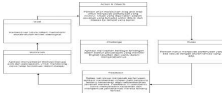
Gambar 2. Skill Atom

Pembuatan skill atom perlu dilakukan agar dapat memberikan pengalaman bermain yang menarik dan memuaskan bagi pengguna. Selain itu , tujuan lain dari pembuatan skill atom juga untuk membuat sistem interaktif yang memotivasi dan menyenangkan (Kim et al. 2023). Dalam penelitian ini sendiri, dibuat skill atom seperti pada Gambar 2.