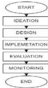
Gambar 1. Alur Penelitian

(Morschheuser et al. 2018). Dari metode tersebut didapatkan bagaimana proses yang dilakukan dalam penelitian ini pada Gambar 1.