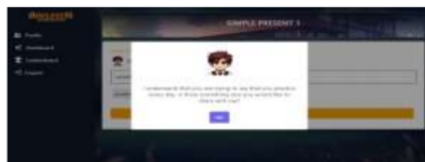
Gambar 8. Tampilan Respon ChatGPT Salah

Pada Gambar 7 tampilan ketika respon chatGPT menyatakan bahwa jawaban dari pengguna adalah benar. Hal ini bisa dilihat dari respon dan gambar yang menyatakan senang. Berbeda ketika respon chatGPT dari jawaban pengguna adalah salah atau tidak sesuai dengan yang diharapkan. Tampilan akan memberikan respon gambar marah dan kalimat yang cenderung kebingungan, sedih, ataupun marah seperti pada Gambar 8.