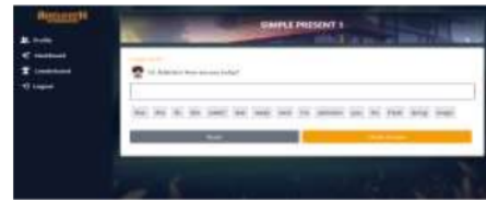
Gambar 6. Tampilan Quest

Tampilan ketika memilih quest pada Gambar 5. Sebelum menyusun kalimat untuk menjawab percakapan, pengguna akan diberikan sebuah prolog cerita. Kemudian setelah prolog itu selesai pengguna akan dihadapkan dengan sebuah percakapan.