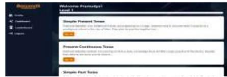
Gambar 5. Dashboard

karena setiap konten memiliki cerita yang berurutan. Disini juga merupakan penerapan unsur gamifikasi quest.