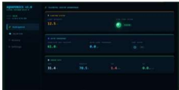
Gambar 7. Tampilan dashboard hasil pembacaan capacitive soil moisture sensor .