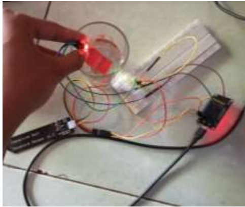
Gambar 4. Pengujian water level sensor pada media air.

Pengujian water level sensor dilakukan untuk mengetahui kemampuan sensor dalam membaca ketinggian air dan menampilkan hasilnya pada dashboard. Sensor diuji dalam tiga kondisi, yaitu tidak dicelupkan ke air, dicelupkan hingga 2,4 cm, dan dicelupkan hingga 4 cm. Dokumentasi pengujian water level sensor ditunjukkan pada Gambar 4.