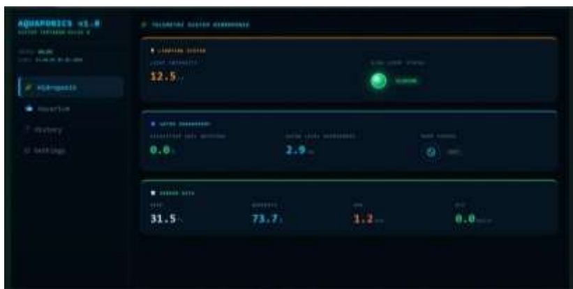
Gambar 8. Tampilan dashboard monitoring data kelembapan media tanam dan level air.

Berdasarkan hasil pengujian, data dari kedua sensor berhasil ditampilkan pada dashboard. Hal ini menunjukkan bahwa ESP32 berhasil menjalankan fungsi sebagai perangkat pembaca sensor dan pengirim data, sedangkan MQTT berfungsi sebagai jalur komunikasi antara perangkat dan dashboard. Sistem seperti ini sesuai dengan konsep smart monitoring, yaitu perangkat sensor membaca kondisi lingkungan, kemudian data dikirimkan ke sistem visualisasi untuk membantu pengguna melakukan pemantauan. Pereira et al. (2023) juga menunjukkan bahwa ESP32 dapat digunakan pada sistem irigasi pintar untuk membaca sensor kelembapan dan menampilkan data melalui aplikasi atau dashboard IoT.