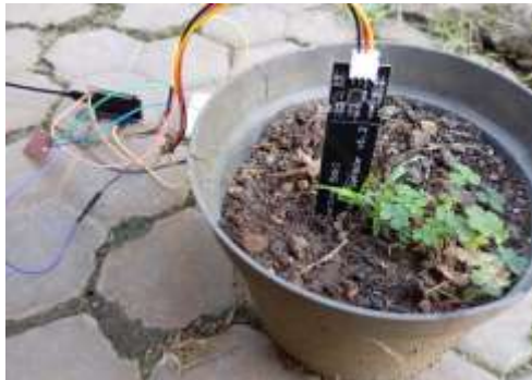
Gambar 6. Pengujian capacitive soil moisture sensor pada pot tanaman.

Pengujian capacitive soil moisture sensor dilakukan untuk mengetahui kemampuan sensor dalam membaca kondisi kelembapan media tanam. Pengujian dilakukan pada pot tanaman biasa karena instalasi hidroponik belum tersedia pada tahap penelitian ini. Sensor diuji pada empat kondisi, yaitu tanah kering, tanah sangat kering, tanah lembab, dan tanah sangat lembab. Dokumentasi pengujian sensor pada media tanam ditunjukkan pada Gambar 6.