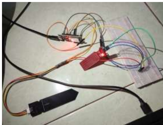
Gambar 2. Rangkaian fisik ESP32 dengan capacitive soil moisture sensor dan water level sensor.

Rangkaian fisik sistem yang digunakan pada pengujian ditunjukkan pada Gambar 2.