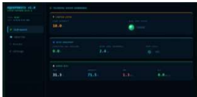
Gambar 5. Tampilan dashboard hasil pembacaan water level sensor.

Hasil pembacaan water level sensor pada dashboard ditunjukkan pada Gambar 5.